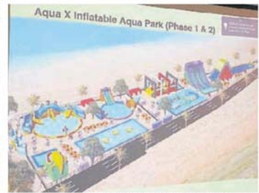
■X人造主题乐园预计将于明年农历新年前完成和开放给大众，可容纳350人。