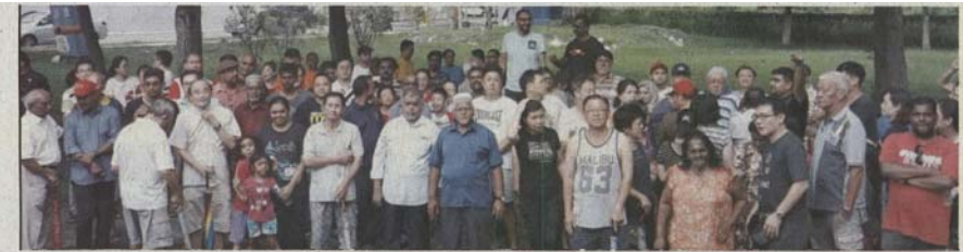
பெட்டாலில் ஜெயந்தவ 25