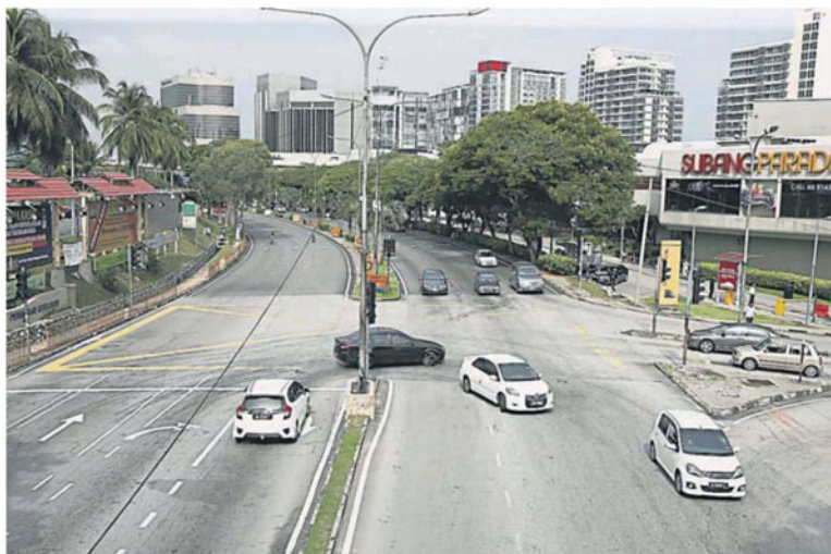
梳邦再也是高度城市化及发展蓬勃地方，梳邦再也市议会过去数年不断尝试申请升格为市政厅。(档案照)

他也说，雪州尚有 2 县即沙白县议会和乌雪县议会未申请，前者是收入和人口都未达标，尚未符合升格的资格，后者虽符合资格，惟最后一次申请是在 2015 年，近期没有向州政府提出申请，此外也欠缺大型屋业发展。