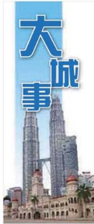
■拉贡山是城市内的公园之一，在周末吸引许多民众到来。