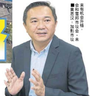
▲ 会有机会升格。 ■ 黄思汉：加影市议会，未