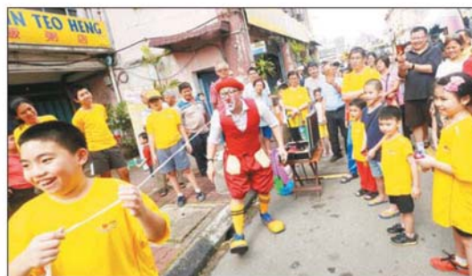
小丑与吉祥物在巴生老街进行街头表演，吸引大人小孩的目光，现场气氛欢乐不已。