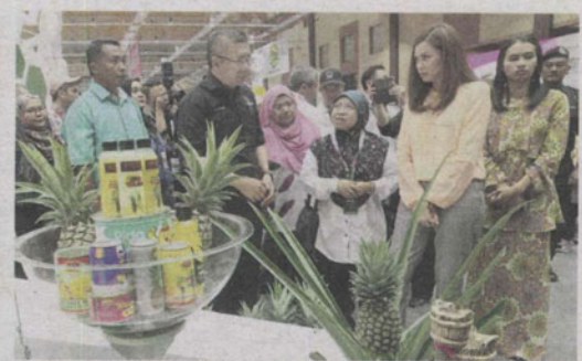
PERMAISURI NORASHIKIN (dua dari kanan) sambil diiringi Menteri Pertanian dan Industri Asas Tani, Datuk Salahuddin Ayub (dua dari kiri) melawat ruang pameran MAHA 2018 di MAEPS, Serdang semalam.

Sementara itu, Tengku Permaisuri Selangor, Tengku Permaisuri Norashikin Abdul