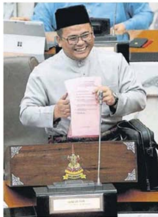
■雪州大臣在2019年财政预算案中捎来好消息,州政府放眼瓜拉雪兰莪县议会明年升格为市议会,梳邦再也市议会则升格为市政厅。

“瓜冷和瓜雪县议会是近期向雪州政府提呈升格的申请,至于梳邦再也市议会早已在数个月就提交申请,雪州政府经过考量后也证实这3个地方政府都已符合条件,无论是稅收还是居住人口都有令人满意的表现。”