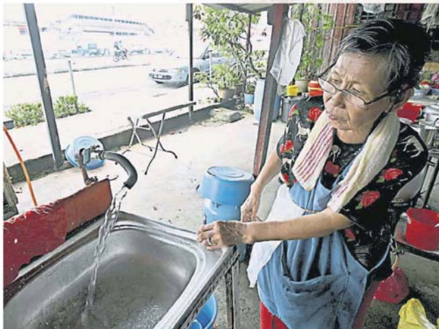
雪州目前实施的首 20 立方米免费水措施，明年将做出调整。(档案照)

阿米鲁丁也是双溪社亚州议员，他是出席雪州义捐局寒学字教育援助金发放仪式，以及出席大马公务员体育福利理事会 (MAKSAK Malaysia)