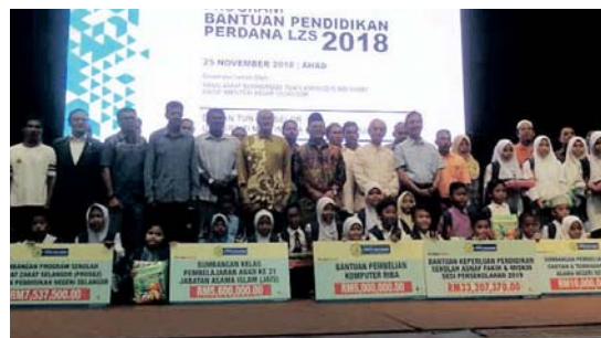
Amirudin bersama sebahagian penerima Bantuan Pendidikan Perdana Zakat Selangor bagi sesi persekolahan 2019, semalam.

Simbolik penyerahan sumbangan disempurnakan Menteri Besar Selangor, Amirudin Shari dalam majlis Penyerahan Bantuan Pendidikan Perdana 2018 di Universiti Multimedia (MMU) di sini semalam.